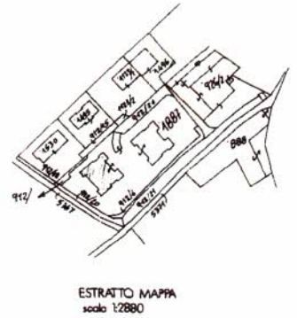
ESTRATTO MAPPA scala 1:2880