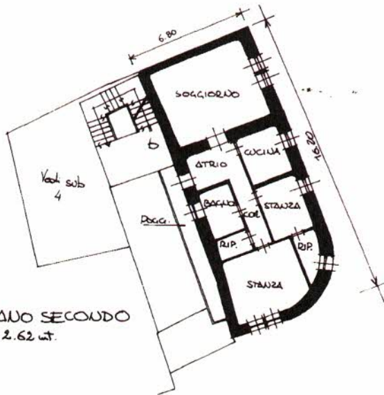
PIANO SECONDO H = 2.62 mt.