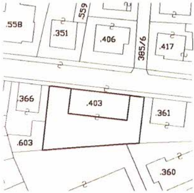
ESTRATTO MAPPA C.C. SACCO F.M. 4 1:1000