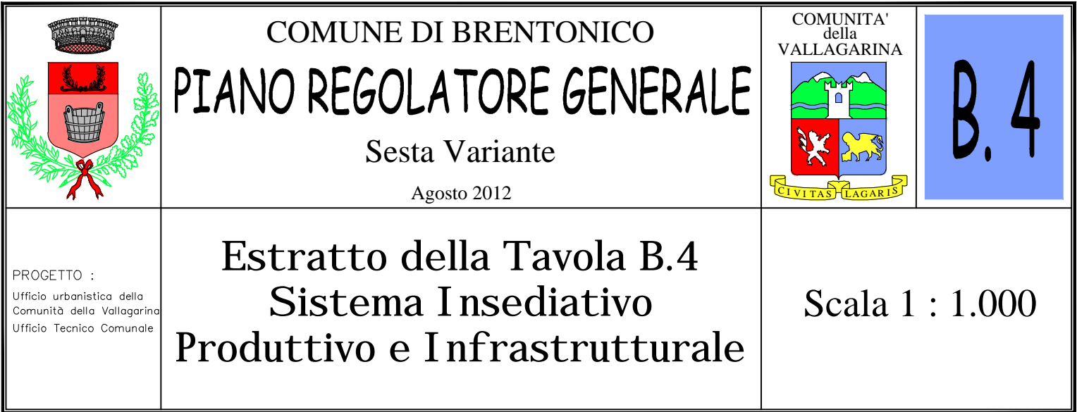
Frazione Brentonico Estratto della Tavola B.4 del P.R.G. in vigore